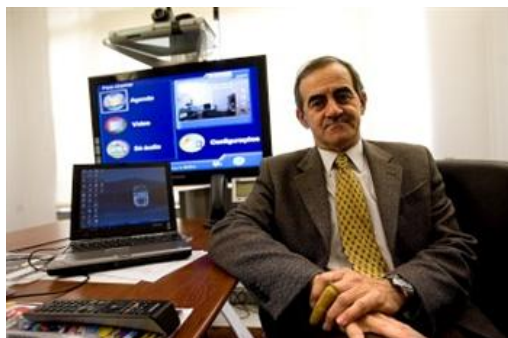
O presidente da FCCN lamenta que poucos domínios em .pt tenham aderido ao sistema (Miguel Madeira/arquivo)

A Fundação para a Computação Científica Nacional (FCCN), que gere o domínio .pt, quer aumentar o número de domínios com um sistema de segurança, já disponível, que garante que os utilizadores acedem mesmo ao site cujo endereço escreveram.